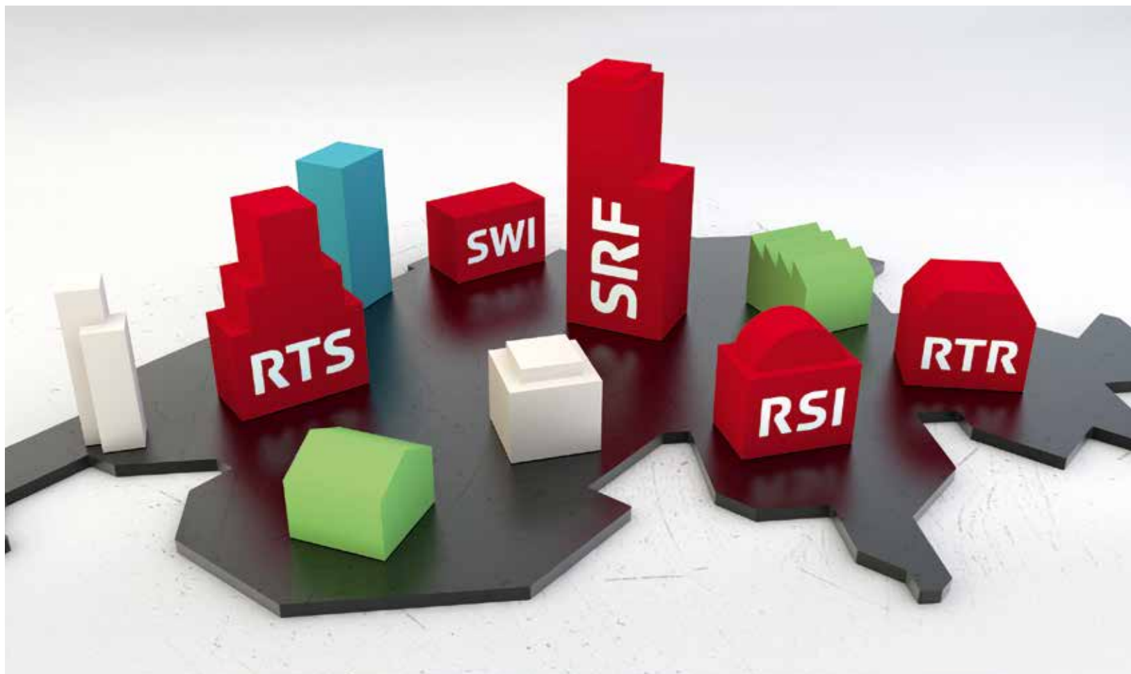
La Societad Svizra da Radio e Televisiun SRG SSR – ina part da la varietad da medias svizra.

La SSR è ina societad privata manada tenor il dretg da la societad anonima cun in'incumbensa sociala particulara (concessiun). Ella gestiunescha in'interpresa da medias per ademplir questa incumbensa.