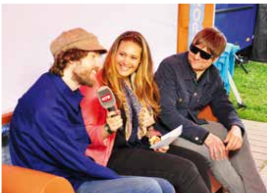
En discurs cun commembers da la gruppa «kaiser chiefs».