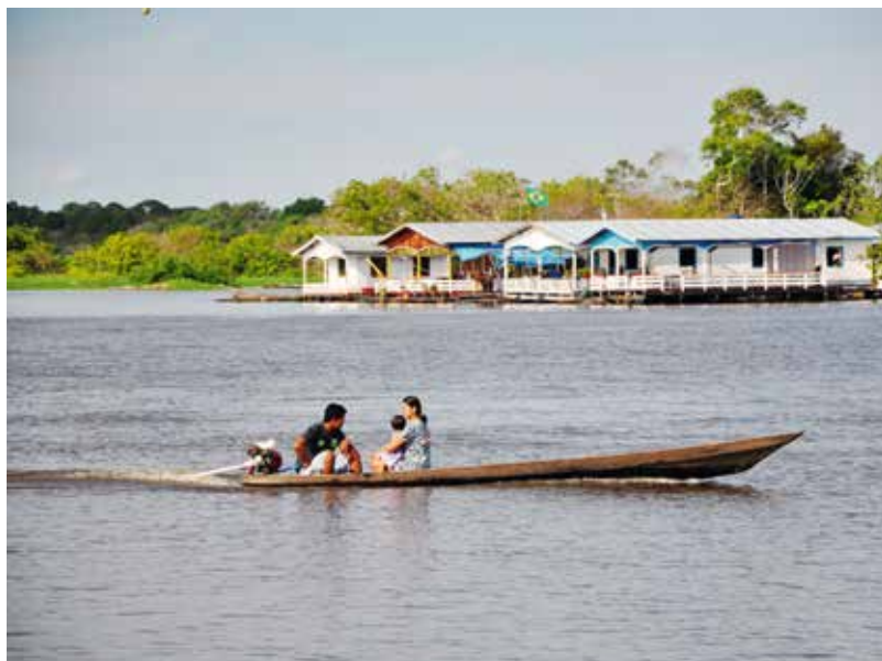
Cuntrasts brasilians: la vita ruasseivla sin la champagna e la hectica d'ina fieria en la citad.