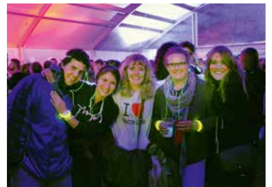
Success cumplain per la battaparty da battaporta.